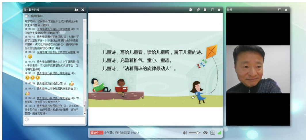
图 10 学科专家组织在线实时答疑活动

依据教学进度以及学员的学习情况反馈，各学科专家定期发布引领学习材料、编制教学答疑简报、开展音视频答疑等活动，以上材料整理后成为学员学习的重要资源，这是专家在培训过程中所产生的生成性资源，是学员学习内容的重要组成。