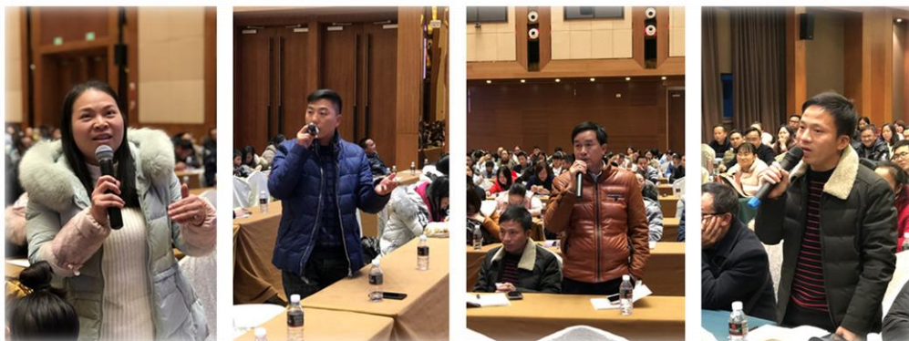
图 8 工作坊线下集中研修活动现场剪影

这次培训活动对于提升黔西南地区教师的教学能力和综合素养起到了积极促进作用，更新了当地乡村教师的教育教学理念，激发了学科教学教研热情，提升了专业教学技能，通过线下互动，大大提升了线上研修热情。