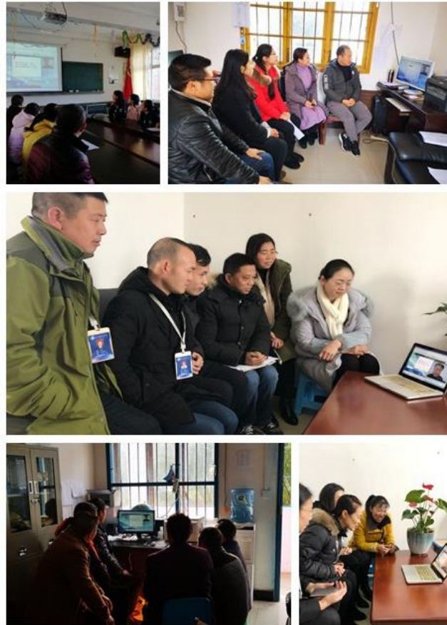
图 11 项目学员通过互联网答疑平台参加学科专家实时在线答疑剪影