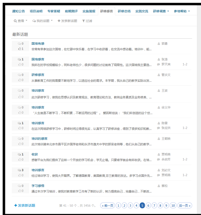
图 9 网络平台学员发表研修感言图示