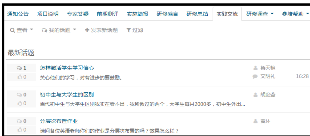
图2 项目网络培训平台截图