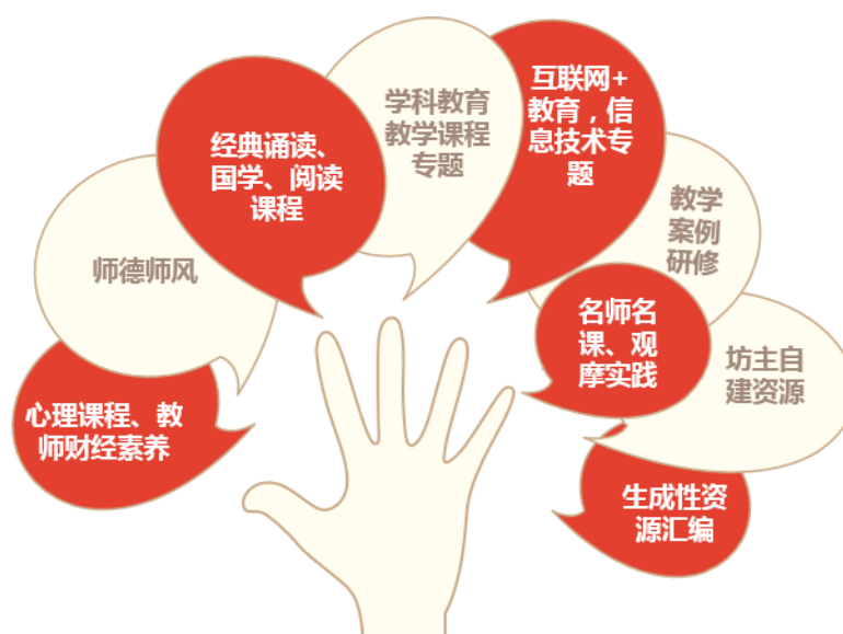
图3 项目提供丰富的网络课程资源供学员选学

与上一年度的培训相比，每个学科的线上课程更新率在40%以上。为贯彻教育部最新精神，新增了《未成年人保护法》《财经素养教育案例》《中国梦·教育梦·教师梦》等视频课程；并针对中西部地区的薄弱环节制作了《思维导图在教育教学中的应用》等视频课程；各学科的学科教学类课程和信息技术类课程也有大幅的更新；同时给学员开放了多门北大专家录制的精品网络课程作为拓展资源。