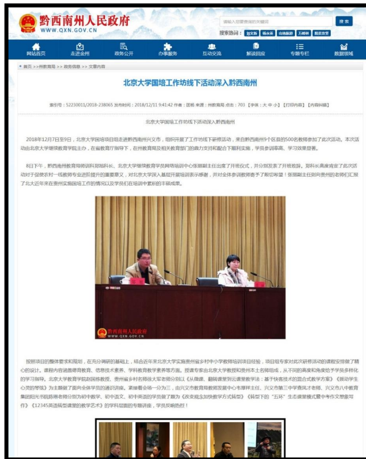
图 7 黔西南州人民政府网站对本次活动进行报道

项目于 2018 年 12 月 7 日至 12 月 9 日,在黔西南州兴义市组织开展了工作坊线下活动,来自黔西南州 9 个区县的 500 名教师参加了此次活动。