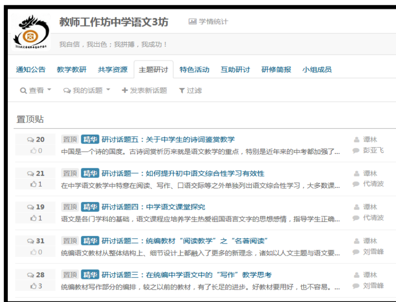
图 12 网络平台“工作坊”研修活动区图示

项目要求坊主按阶段撰写研修简报，对工作坊的学员学习情况定期总结、及时反馈、表扬优秀、鼓励成长为小专家等，这是坊主在培训过程中所产生的生成性资源。