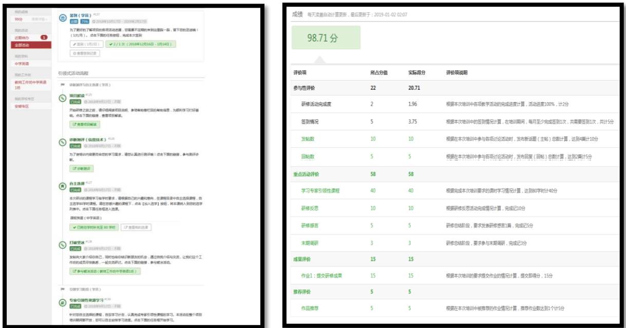
图5 网络平台学员端学习界面图示

同时，研修平台为学员、坊主配置了既定的研修活动流程，按照时间顺序分为四个阶段：诊断测评与自主选课、引领学习阶段、实践与反思阶段、研修总结阶段，此外，还有常规性活动贯穿始终。各角色按照平台提醒的时间安排来参与各阶段的活动、完成各阶段的任务。