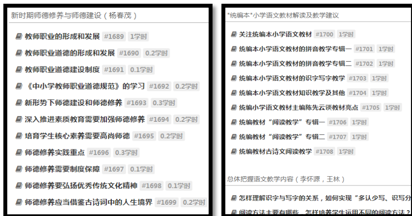
图 4 网络平台课程资源列表图示